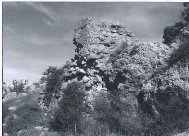
Restos del castillo de Serrella