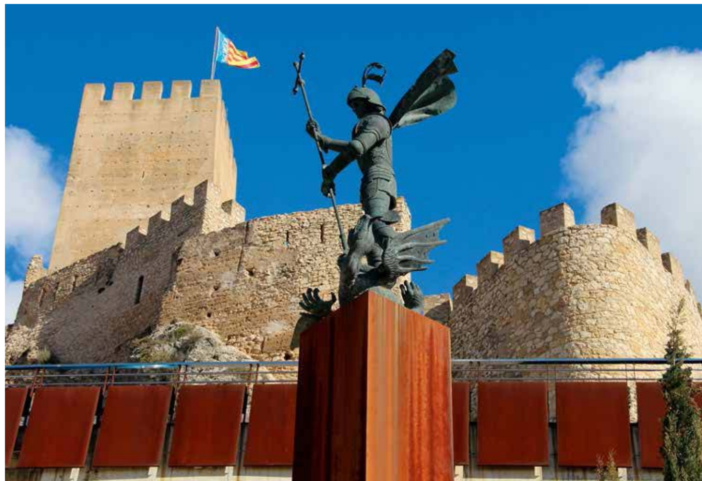
Emergint a l'Oest, sobre les ruïnes de l'antiga "Ermita del Conjurador" una imatge de tres metres i mig d'altura domina la vall, al peu del castell, en un lloc amb una panoràmica privilegiada de la Penya la Blasca, l'Alt de la Barcella i la Vall del Vinalopó, monument que s'alça per a transmetre'ns la pau i l'assossec que des d'allí se sent en contemplar la posta de sol o el clarejar d'un nou dia. Lloc privilegiat per a la meditació, el qual alberga entre les seues pedres la història del nostre poble i on la festa representada amb les seues banderes ens recorda que hem anat sempre junts i de la mà, sota la seua mirada serena i bondadosa.