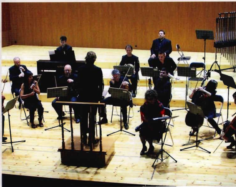
Ensemble Orquesta "Ciutat de Llíria"

El Divertiment n.º 11 en re mayor, K. 251 , va ser escrit al mes de juliol de 1776 a Salzburg, possiblement per l'onomàstica de la germana de Mozart, Nannerl, el 26 de juliol o pel seu aniversari el 30 de juliol. El moviment inicial està escrit en forma de sonata monotemàtica en la qual en lloc del vertader segon subjecte en la tonalitat de la dominant (la major), el primer subjecte apareix en la menor. El trio del primer minuet està compost sol per a cordes i el tercer moviment, de tempo Andantino , està en forma rondó. El quart moviment és una inusual barreja de minuet i forma variacions. Ací, les tres variacions serveixen com els "trios", amb el tema del minuet tornant da capo després de cada variació. La primera d'aquestes variacions es caracteritza per l'oboè sol, la segona pel violí sol i en la tercera, la melodia de la segona flueix per davall del tema. Les trompes no participen en cap de les variacions.