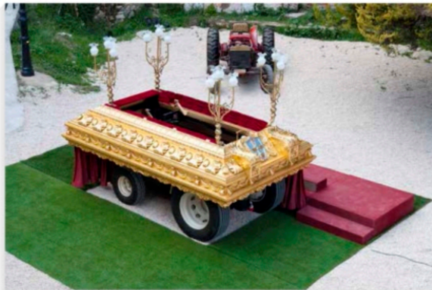
Presentación del nuevo tractor y restauración de la carroza de San Jorge, 9 de marzo de 2013.