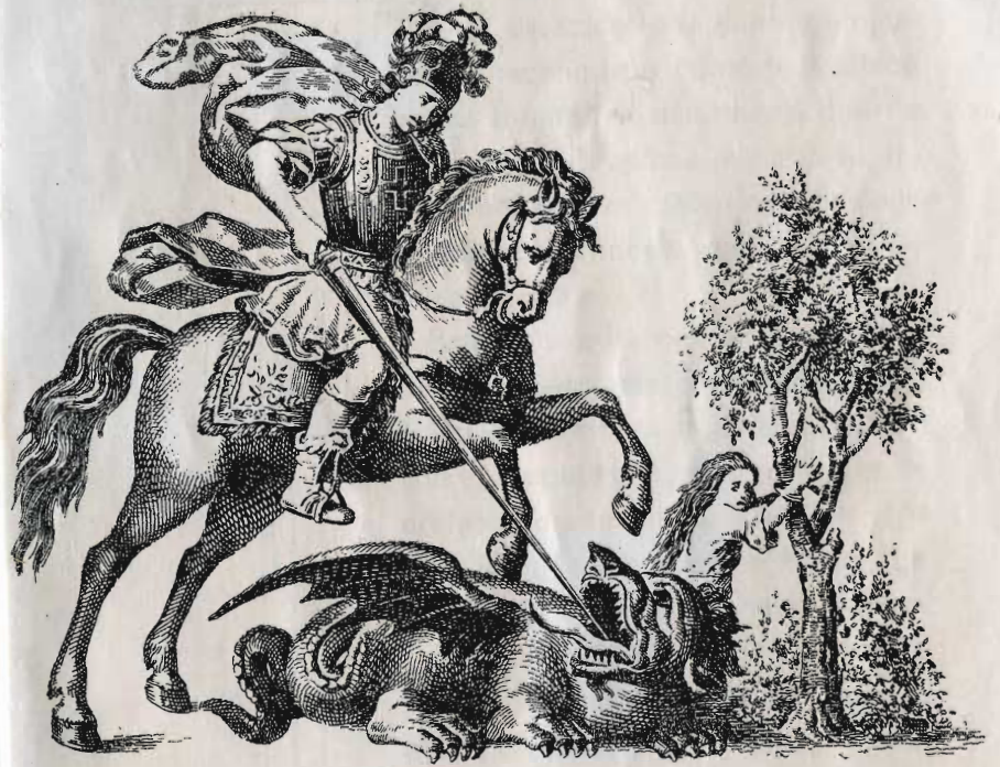
LA PAPELERA DE SAN JORGE