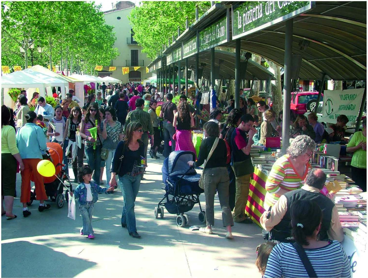
Fira del llibre a Barcelona. 23 d'abril