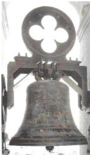
Campana denominada Ntra. Sra. de la Misericordia.

Las campanas actuales son las siguientes (127);