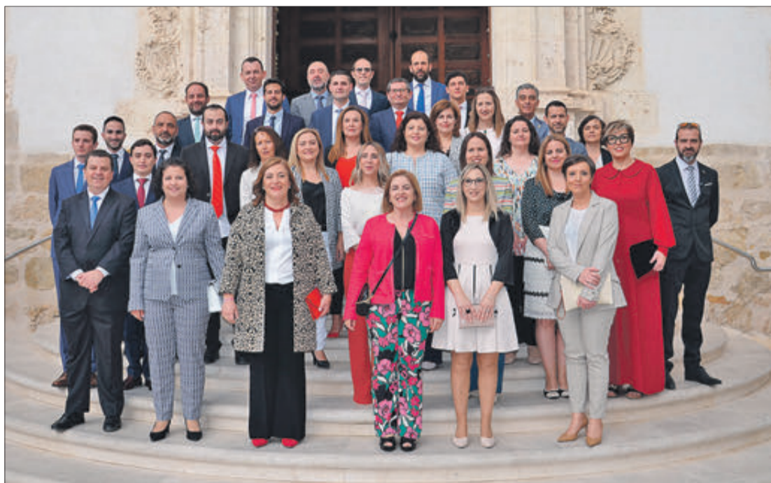
Composició de la nova junta de la Confraria de Sant Jordi.

Per a poder participar és necessari estar federat o tindre una assegurança de senderisme. Per a les persones que no compten amb aquest requisit l'organització facilitarà una assegurança per a poder fer la marxa, per la qual cosa caldrà abonar un import de 3 euros.