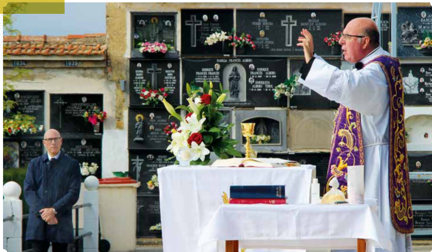
Celebració de la Missa pels festers difunts. 25 d'abril de 2020.

En eixe context, quan es van acabar els actes de festes el dia 3 de maig, alguns membres de la Junta preguntaven si "ja havíem acabat com a Junta de la Confraria". Com a president, els vaig comentar que si s'hagueren pogut fer les festes de la Relíquia, les hauríem organit-