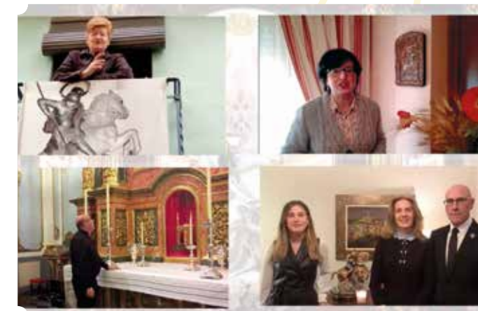
Vídeo de la Confraria de Sant Jordi llançat a les xarxes socials després de la Missa Major de Sant Jordi. 23 d'abril de 2020.