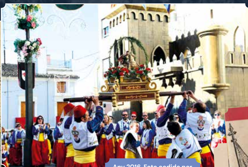
Any 2016.