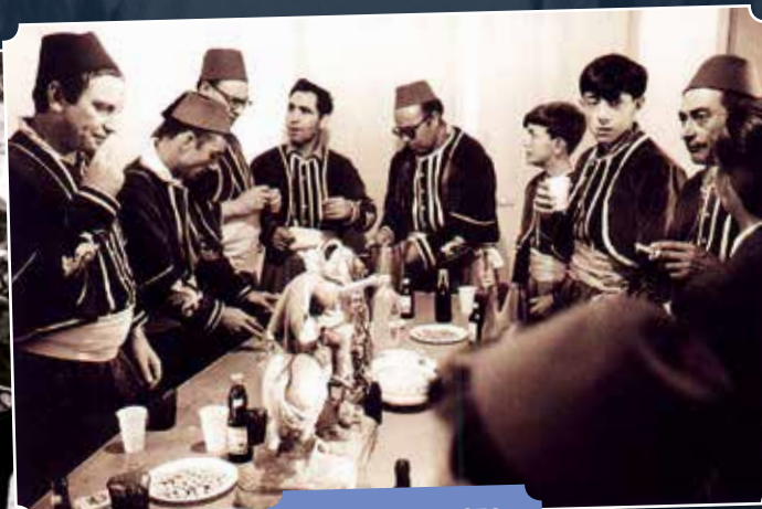
Inicis dècada 1970.