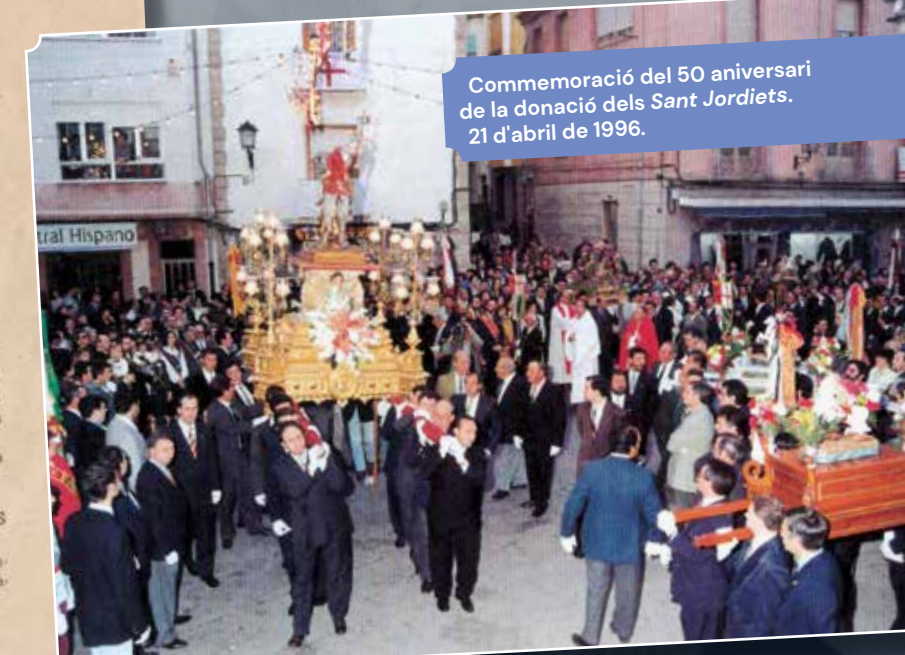
Commemoració del 50 aniversari de la donació dels Sant Jordiets . 21 d'abril de 1996.

El dia 21 d'abril de 1996, amb motiu del 50 aniversari d'aquesta efemèride, les deu fil·laes van dur a muscle el seu Sant Jordi des del Temple Parroquial fins l'ermita de Sant Jordi. A continuació, totes les imatges del Sant van tornar en processó fins al Temple Parroquial, acompanyant així la imatge de Sant Jordi que habitualment presidix la seua ermita i que durant els dies de festes venerem a l'altar major.