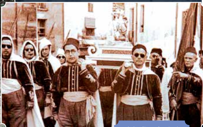
Inicis dècada 1950.